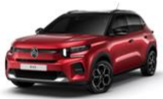
PERLA NERA SCHWARZ