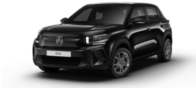
PERLA NERA SCHWARZ