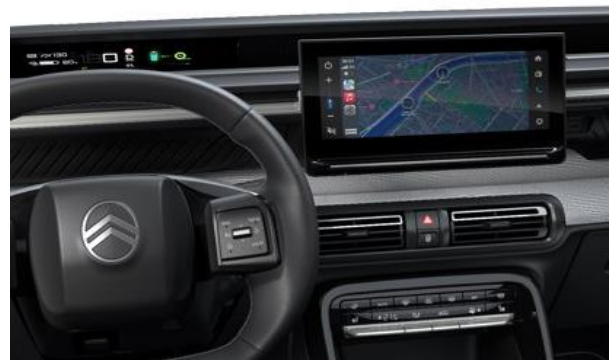
MY CITROËN DRIVE PLUS (MAX)