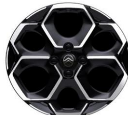
17 Zoll Leichtmetallfelgen ATACAMITE