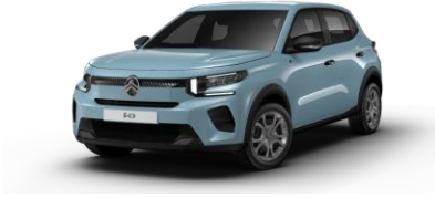
MONTE CARLO BLAU