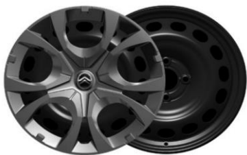
16 Zoll Stahlfelgen PYRITE