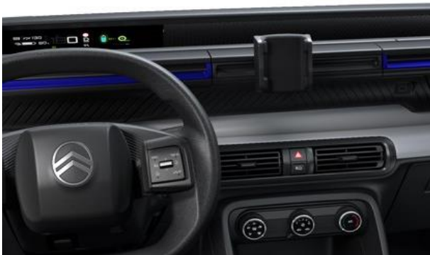
MY CITROËN PLAY (YOU)