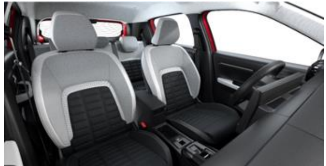
INNENRAUM METROPOLITAN GREY