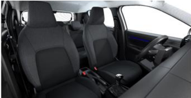
STOFF MICA GREY